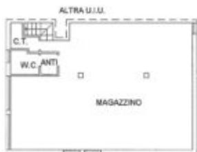
PIANTA PIANO INTERRATO H=240